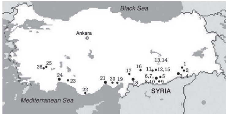
図1 調査地概図 (数字は表1の試料番号を示す)

カリボール法、硫酸イオン ( \text{SO}_4^{2-} ) は硫酸バリウム比濁法 (460nm)、亜硝酸イオン ( \text{NO}_2^- ) はナフチルエチレンジアミン法、アンモニウムイオン ( \text{NH}_4^+ ) はインドフェノール青法、リン酸イオン ( \text{PO}_4^{3-} )